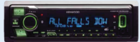
Die Beleuchtungsfarben von Display und Tasten können unabhängig voneinander beliebig variiert werden